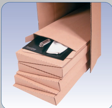
DecoFlag in Einzelverpackung