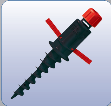
Bodendübel „Ground Drill“