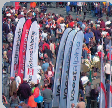
BeachFlag: auf Outdoor-Events unübersehbar