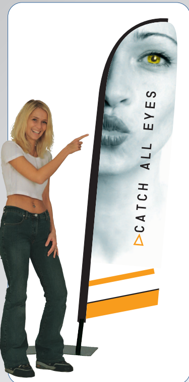
DecoFlag (2,20 m Höhe) mit Metallfuß