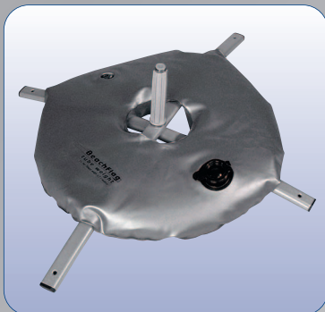
Optional: Faltkreuz mit Schlauchgewicht

Zum Lieferumfang der BeachFlag gehört der schraubbare Bodendübel „Ground Drill“. Für harte Untergründe, wie beispielsweise Beton, können Sie ein optionales Faltkreuz erwerben.